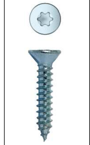
Imagen de producto/ Product picture