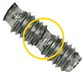
Corte a medida